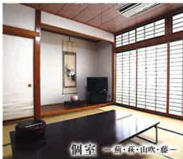
個室 ー 筒・萩・山吹・藤一