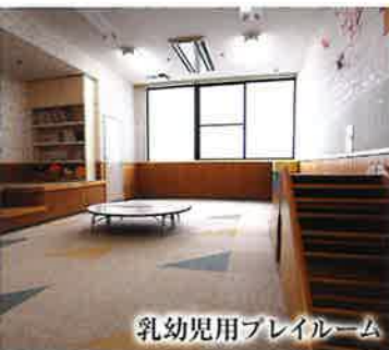
乳幼児用プレイルーム