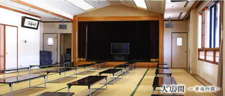
大広間 ー 辛夷の間