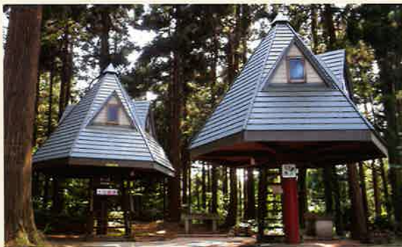
うまみち森林公園 バンガローハウス