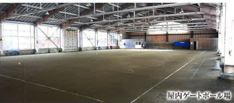
屋内ゲートボール場